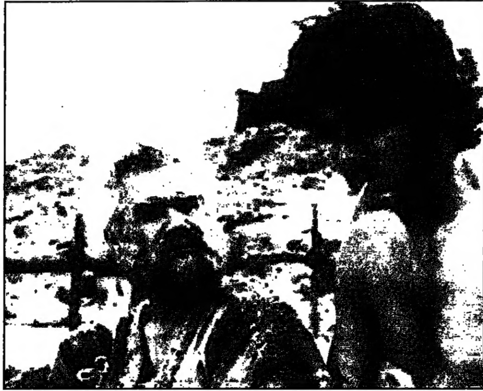
لغة من فيلم المهاجر، يوسف شاهين